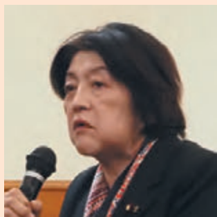
衆議院議員 大河原雅子 殿

祝賀式典には多くのご来賓より、 心のこもったご祝辞を頂戴しました ありがとうございました