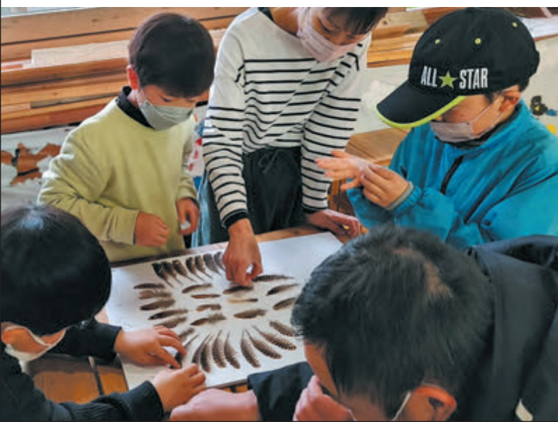
▶センサーカメラに映る「ヤマシギ」 ◀子供たちと拾った羽を並べる様子

市内に広く分布しているとはいえ、日中にヤマシギを観察する機会は多くありません。茂みでじっとしていると、背景にうまく溶け込んで見つけづらいからです。出会う時はいつも時すでに遅し・・・私の接近に驚き、慌てて飛び去っていく後ろ姿を茫然と見送ることになります。そんなヤマシギですが、意外なことからその生息を知ることもあります。一つはセンサーカメラです。夜行性の哺乳類を調べるために設置したセンサーカメラ(自動撮影装置)に、通りすがりのヤマシギが撮影されることがあるのです。もう一つは猛禽類の食痕です。地上で活動するヤマシギは、オオタカなどの猛禽類に襲われることが多く、襲撃後は倒木の上などで羽をむしられます。雑木林を歩いていて、散乱したヤマシギの羽を見つけることは珍しくありません。人知れず、実際には相当な数のヤマシギたちが八王子で冬を越しているかもしれませんね。