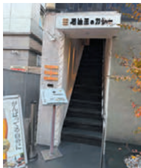
お店は2階になります

フレンチのシェフが、「25種類のスパイス、グルテンフリー、化学調味料無添加」をベースに、キッチンカー、お店でゆっくり食べられる贅沢なカレーを開発。大楽寺には、石油王のカレー研究所を設置し、メニューの改良と新商品の開発、レトルトカレーの開発、製造を行っています。「イベントなど八王子市内はもとより、他県にもキッチンカーを積極的に展開し、販売しています。更に、海外のイベントにも出店しています。皆さまに、店舗へのご来訪をお待ちするとともに、イベント会場にてお目にかかれますことを願っております。」(久平店長)