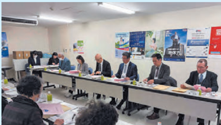
▲山下副会長（右から4番目）をはじめ福岡中部法人会の皆さま