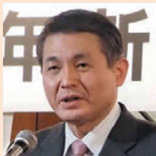
八王子市長 初宿和夫 殿