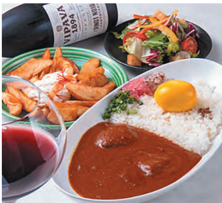
単品からコース、アルコールまで懇親会など開催できるメニューを揃えます