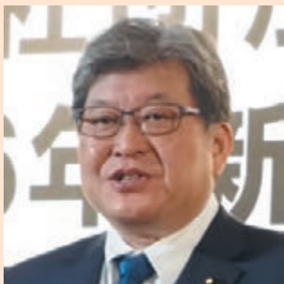
衆議院議員 萩生田光一 殿