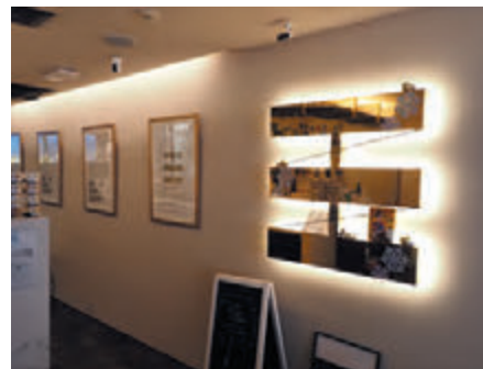
店内は大きな王のライティングが目を引きま