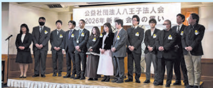
ご参加いただいた12社13名の新会員の皆さま