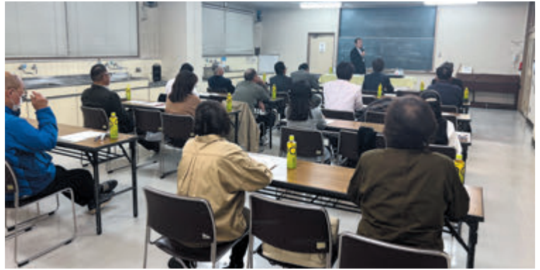
▲実例を交えた解説で参加者に分かりやすい内容でした

元八地区では11月6日に税務セミナーを開催。「電子帳簿保存法」の定めにより、2024年1月から、電子データで受け取った請求書、領収証などは、電子データの状態で保存することが義務付けられるようになります。こうした点について、各企業における適切な対応の進め