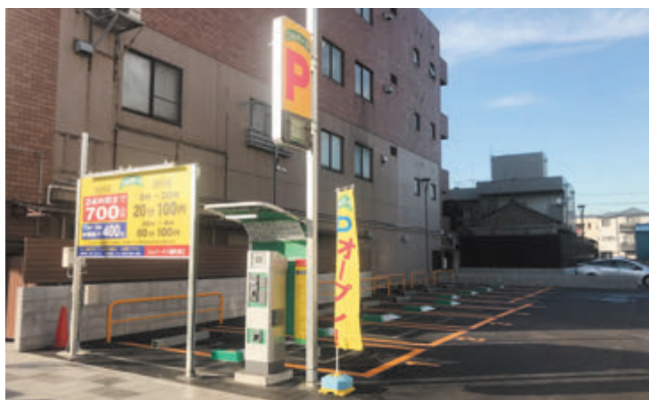
安心して利用できるコインパーキングを展開しています

〒192-0063 八王子市元横山町2丁目6-17 TEL: 042-643-5556 FAX: 042-643-5557 http://www.comnet-p.co.jp/