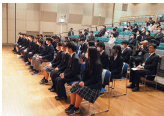
保護者や学校関係者が見守る中、表彰式は開催されました

今までの私は、税金について深く考えたことがなかった。しかし、今回これらのことを調べてみて、税金について考えることは自分の将来の進路を考えることと同じであるのだと気付いた。一人の納税者としても、これから未来を担っていく世代の一人としても、税のことはよく知り、よく考え、よく声を上げるべきだと思う。税金は様々な場所で耳にする身近なものだが、考える機会はそれほど多くないように感じる。周りの人と税について、私たちのこれからについて話し合ってみよう。