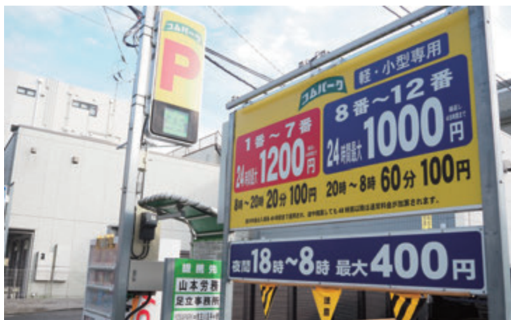
利用しやすい価格帯で地域貢献 ※写真は一例です

「お客様と直接触れ合う機会は少ないですが、コインパーキングの利用を通して、街が新型コロナウイルス感染症から回復してきた事を実感でき嬉しく思います。駐車場はインフラの一部になり得ます。今後も駐車場を整備することで、地域の賑わいを下支えしていきたいです。コインパーキングは建物を建設するよりも土地所有者様の投資額が少なく、低リスクで始める事ができます。当社は、私を始め宅建の資格を持つ社員が複数名おりますので、土地に関するご相談などございましたらお気軽にお問い合わせください。土地の有効活用の一つとしてお役に立てれば幸いです。」(山口社長)