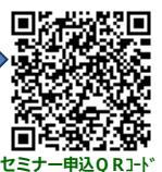
セミナー申込QRコード

*本申込書にご記入いただいた個人情報等につきましては、今回の事業開催に係る申込者の確認・名簿の作成・運営に関する連絡及び報告、各種セミナー等開催連絡の目的にのみ使用いたします。