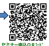
セミナー申込QRコード

※本申込書にご記入いただいた個人情報等につきましては、今回の事業開催に係わる申込者の確認・名簿の作成・運営に関する連絡及び報告、各種セミナー等開催連絡の目的にのみ使用いたします。