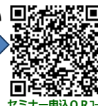
セミナー申込QRコード

※本申込書にご記入いただいた個人情報等につきましては、今回の事業開催に係る申込者の確認・名簿の作成・運営に関する連絡及び報告、各種セミナー等開催連絡の目的にのみ使用いたします。