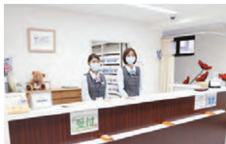
スタッフが笑顔でお出迎えます