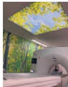
CT室は緑の樹木の絵で覆われ心が安らぎます