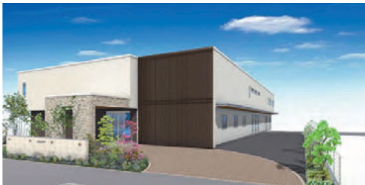
2024年春『片倉おなかクリニック』オープン予定

〒192-0083 八王子市旭町12-12 TEL: 042-644-1127 FAX: 042-644-1380 https://www.m-onaka.com/