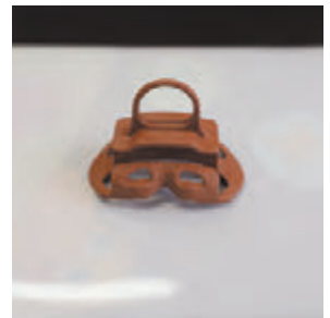
改良が進む製品の小型精密部品用部品から柔らかい製品まで多種多様