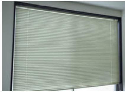
基幹製品のブラインド