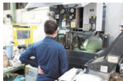
社員の管理のもと稼働します