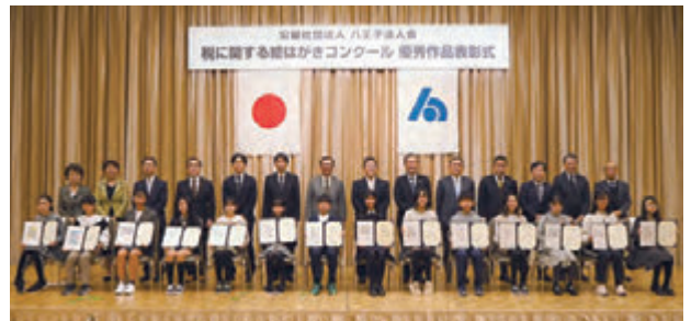
▲昨年度の表彰式（京王プラザホテル八王子）