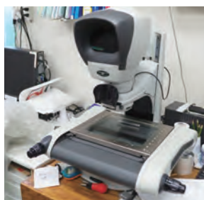
非接触光学測定顕微鏡