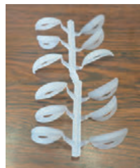
シリコン素材の商品一例