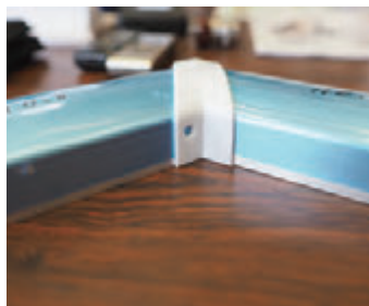
特別な角度で設計された製作途中のマンションの手すりの一部