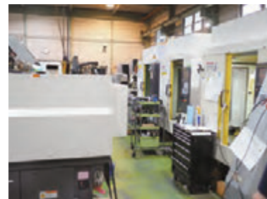
様々な工作機械が並んでいます