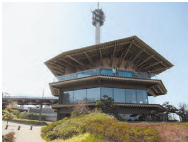
▲富士山から静岡市街地まで見渡せる日本平夢テラス

久能山東照宮を降りたところには、石垣いちご農園が広がり、いちごの食べ放題を満喫。来年度の行先に期待を膨らませながら、無事に帰路につきました。