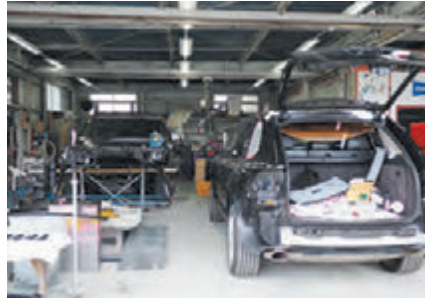
綺麗に塗装、修復されていきます

また、コロナ禍において多目的コンテナ車の需要も高まり、キッチンカーやキャンピングカーなどの製作にも力を入れています。