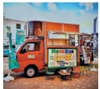
軽トラック用多目的コンテナ「ムーボ」の一例