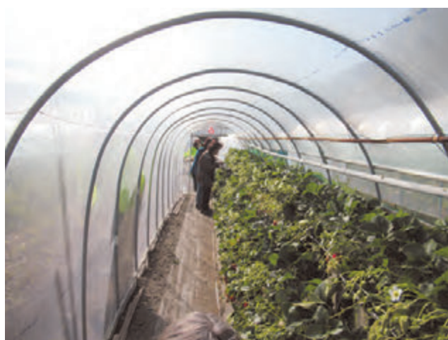
▲石垣いちご農園のビニールハウス