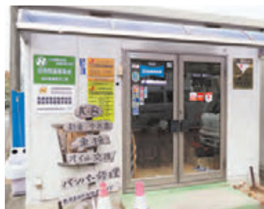
(有)越野ボディー事務所