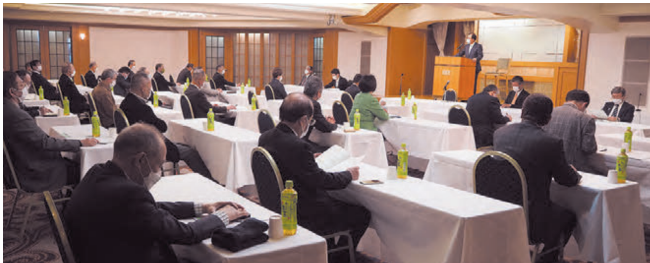
▲多数の理事が出席する中、事業計画（案）・収支予算（案）を慎重に審議