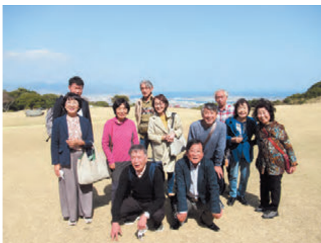
▲霞んで見えにくかったですが、富士山をバックに記念撮影