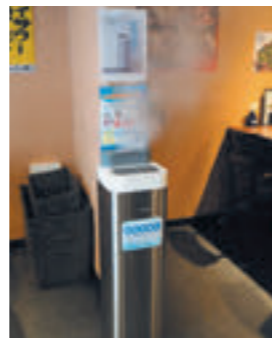
空間除菌デバイスを各フロアに設置