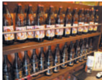
ボトルキープされたオリジナル焼酎の数々

本部 〒192-0071 八王子市八日町10-19加藤ビル3F TEL : 042-655-0877 FAX : 042-655-0878 http://www.fc-zidori.com/