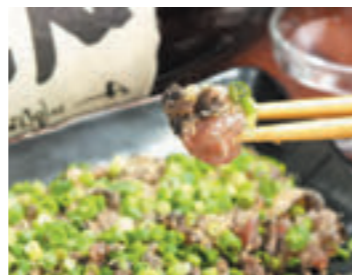
単品からコース料理まで数多くのメニューをそろえています。