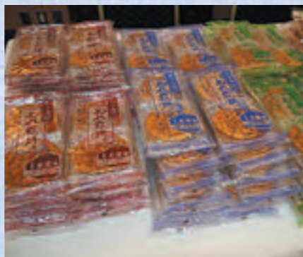
当日物販した名物“ぬれ煎餅”