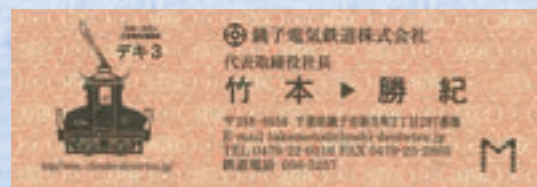
切符のデザインを取り入れた竹本社長のユニークな名刺