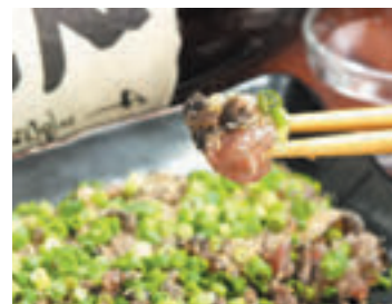
単品からコース料理まで数多くのメニューをそろえています。