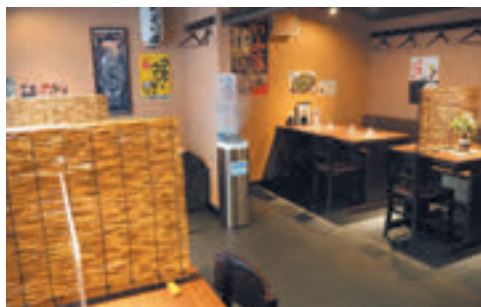
店内は十分な間隔を取り感染対策を徹底 コロナ禍の時短営業に則したお得なセットメニューも展開