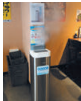
空間除菌デバイスを各フロアに設置