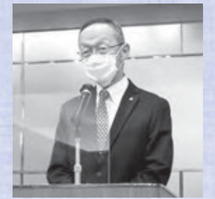
新井地区会長（中央地区）

※制度内容の詳細については、今後、「きずな」の誌上、及び当法人会ホームページでも掲載していきます。また、本ご紹介した以外の地区、部会においても同様の説明会が企画される予定です。