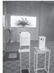
本社エントランス