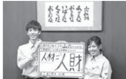
新たな人材を募集しています。

本社 〒192-0051 八王子市元本郷町3-11-17 TEL: 042-624-8069 (代) FAX: 042-624-8060 https://www.yamaroku.co.jp/index.html e-mail: keiri@yamaroku.co.jp 営業時間 月~金 8:00~17:00