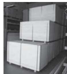
倉庫内は大きなベニヤ板から小さな工事用小物まで在庫を確保