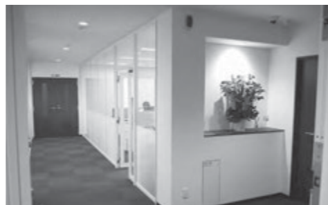
明るく開放感ある社内と季節の花が飾られています。