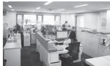
感染防止が徹底された事務所