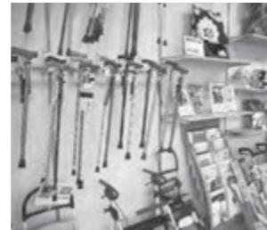
ミニロクメイト事業部 取り扱い商品の一例