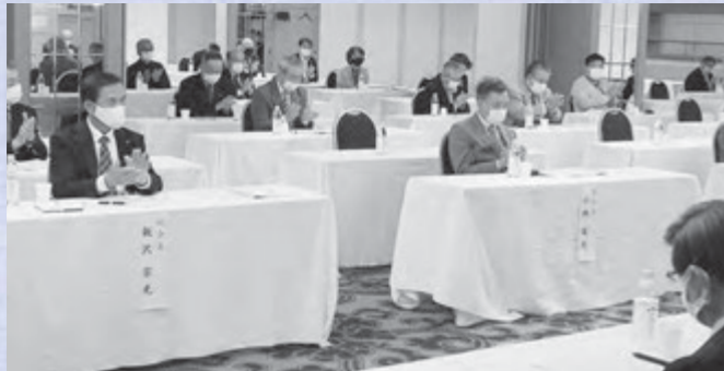
▲40名以上の理事・監事が出席 ZOOMを利用したリモート出席にも対応▼