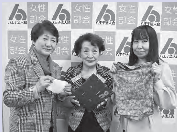
記念品を手にする女性部会役員

2020年4月、設立35周年を迎えた同部会では、約1年半前から特別委員会を設置して記念事業を企画。当初は他地域の女性経営者との交流を目的とした視察旅行を予定していましたが、新型コロナウイルス感染症の拡大により実施を断念。昨年初夏の頃より、記念事業の内容を一から検討し直した結果、八王子織物によるマスクと、エコバックとしても利用可能なオリジナルバックのセットを制作。記念品として部会員全員に贈呈す