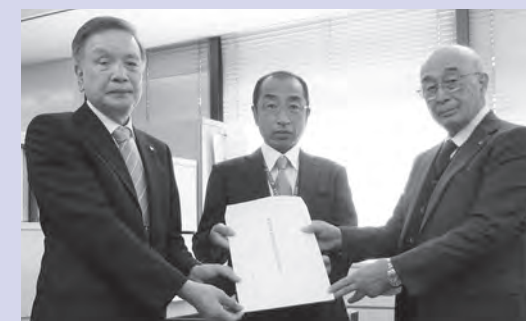
八王子市長 石森孝志氏 ～代理: 宇田川税務部長(中央)～