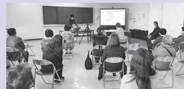
感染対策のためスクリーンを使い、講師の手元を拡大

当日は、作業をする講師の周囲に受講者が集まることを防ぐため、ウェブカメラで講師の手元を撮影し、会場のスクリーンに大きく投影する方法も感染症対策の一つとして取り入れました。