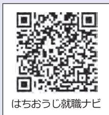
はちおうじ就職ナビ