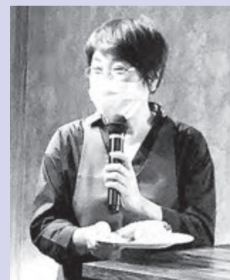
カニカマハナコさん

当日は、数々のレシピの誕生秘話などを語っていただくとともに、試食会も開催。参加者にとっては、カニカマ料理の奥深さを実感するひと時となりました。