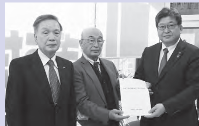
文部科学大臣/衆議院議員 萩生田光一氏(右)