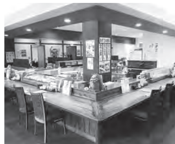
開放的なカウンター席