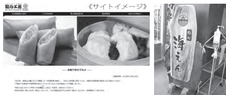
オンラインショップサイトイメージ