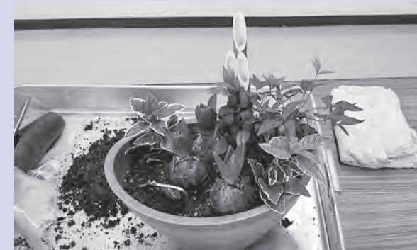
完成した、お正月を連想させる寄せ植え