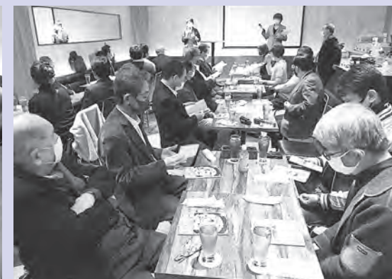
試食用のカニカマ料理とトークショーの様子