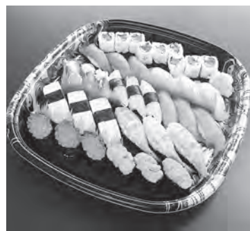
デリバリー特上すし