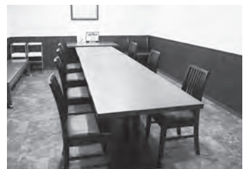
十分な座席間隔を確保した個室