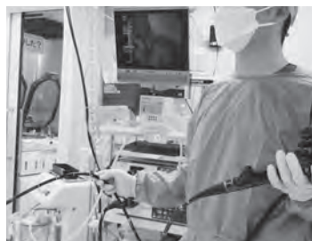
个人防护具の着用