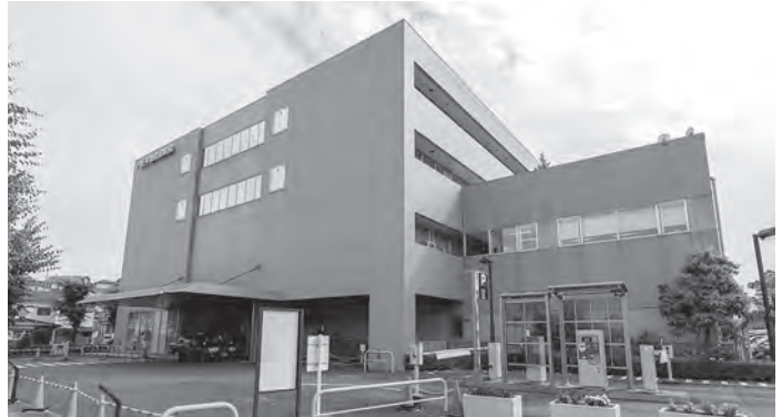
病院外観（39台分の専用駐車場を完備しています。）