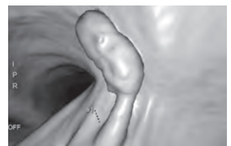
大腸CT検査による仮想大腸内視鏡像