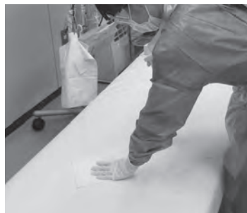
検査ベッドの消毒