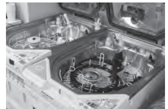
ビデオスコープの洗浄