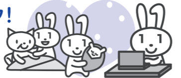
マイナンバー-PRキャラクター マイナちゃん